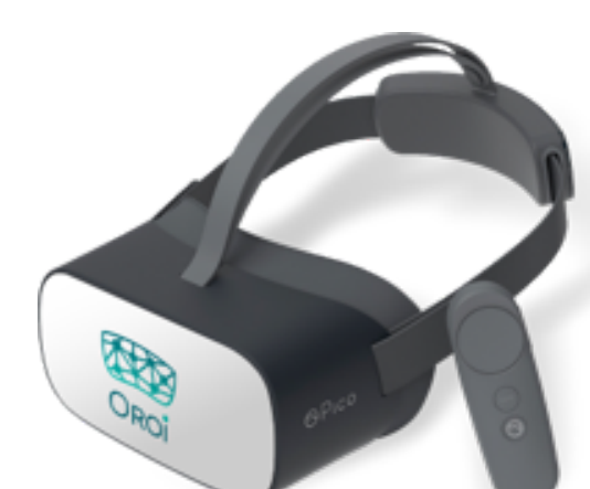
Casque RV Oroï